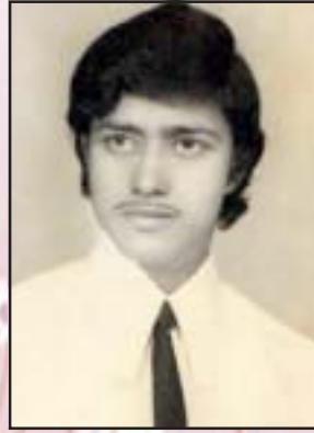
1972 में प्रथम प्रकाशित शज़ल का शायर